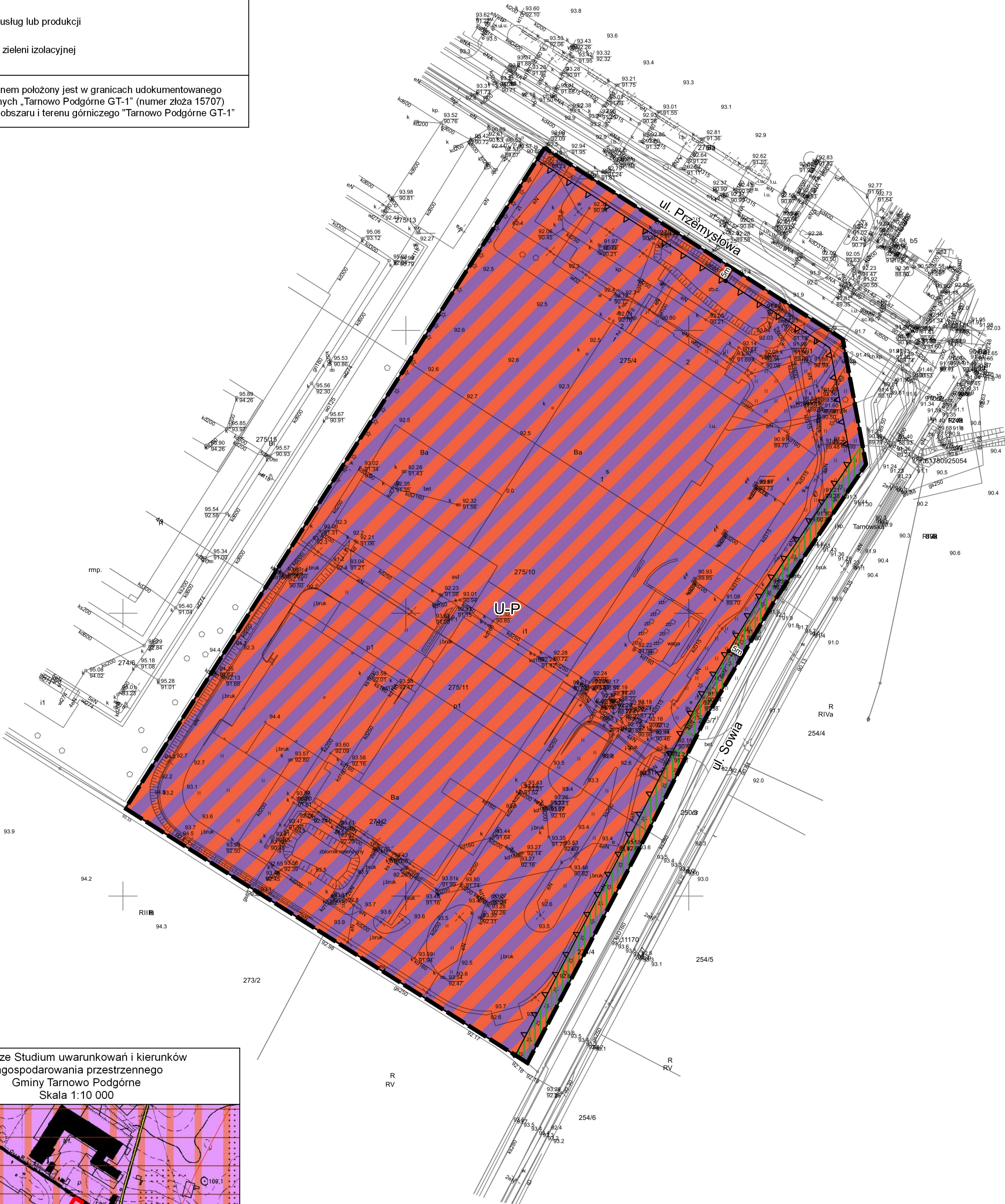
Wyrys ze Studium uwarunkowań i kierunków zagospodarowania przestrzennego Gminy Tarnowo Podgórne Skala 1:10 000