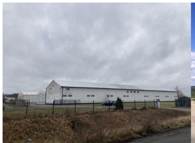
Tereny niezagospodarowane w obrębie planu