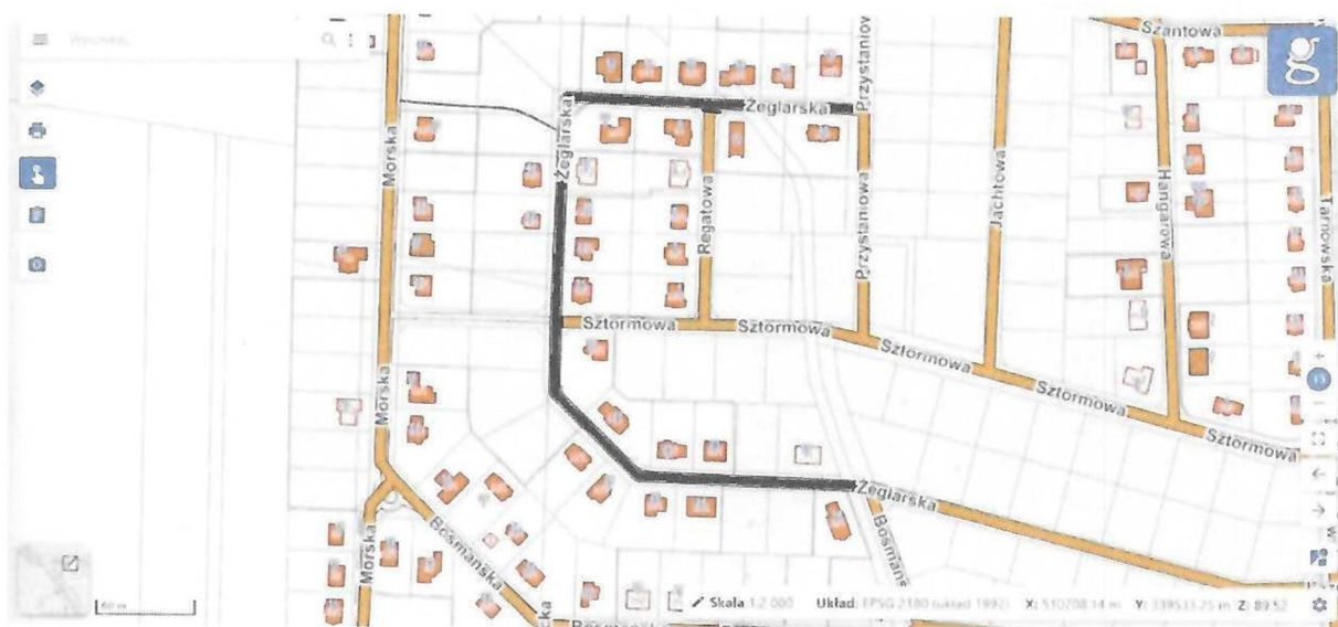
Rysunek 1. Obszar drogi gminnej na ul. Żeglarskiej, o którą wnioskuje mieszkańcy.

My, niżej podpisani mieszkańcy Osiedla Morskiego na podstawie art. 63 Konstytucji Rzeczypospolitej Polskiej z dnia 2 kwietnia 1997 r. (Dz.U. 1997 nr 78 poz. 483) oraz ustawy z dnia 11 lipca 2014 r. o petycjach (t.j. Dz. U. z 2017 r., poz. 1123) zwracamy się z prośbą o podjęcie niezwłocznych działań związanych z budową ulicy Żeglarskiej na odcinku od ulicy Przystaniowej do dz. nr 385/121 wraz z odwodnieniem, chodnikiem, ulicznymi kosztami na odpady i odchody zwierzęce, zgodnie z obszarem zaznaczonym kolorem czarnym na Rys. 1.