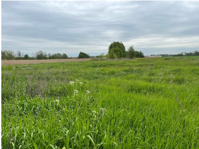
12. Dokumentacja fotograficzna. Widok od strony ulicy Św. Mikołaj: