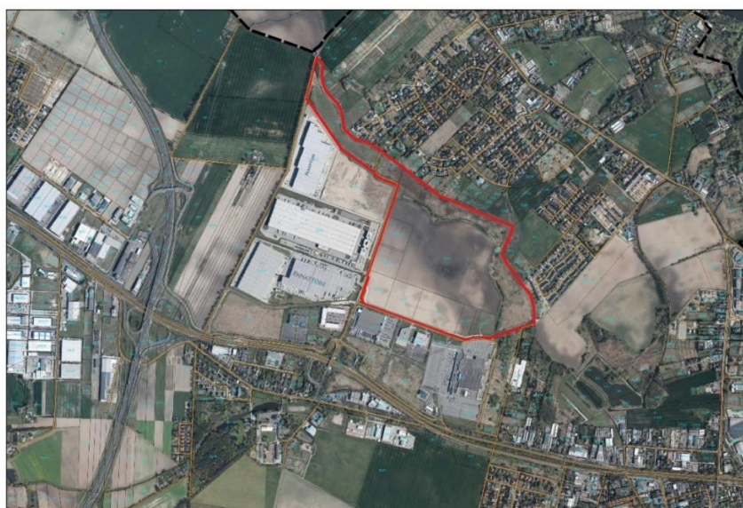
Lokalizacja obszaru opracowania mpzp, opracowania własne.

W studium uwarunkowań i kierunków zagospodarowania przestrzennego gminy Tarnowo Podgórne, zatwierdzonego uchwałą Nr L/852/2022 Rady Gminy Tarnowo Podgórne z dnia 29 marca 2022 r. dla terenu opracowania mpzp wskazano następujące kierunki: B_UC – teren usług – obiektów handlowych o powierzchni sprzedaży powyżej 2000 m 2 oraz wzdłuż północnej granicy tereny zieleni – łąk pastwisk, wód powierzchniowych. W obszarze objętym ww. uchwałą obowiązuje zmiana miejscowego planu zagospodarowania przestrzennego terenów działalności gospodarczej w Swadzimiu, przyjęta Uchwałą nr LXXXI/157/2006 Rady Gminy Tarnowo Podgórne z dnia 5 września 2006 r. Zasadność opracowania zmiany ww. planu wynika ze złożonych wniosków, dotyczących m. in. realizacji elementów izolujących tereny przeznaczone pod zabudowę w planie od sąsiadujących terenów zieleni oraz osiedla mieszkaniowego w Chybach. Zasadnym stało się też dostosowanie zapisów planu do stworzenia formalnych możliwości nieodpłatnego przekazania na własność Gminie nieruchomości wchodzących w skład Zasobu Krajowego Ośrodka Wsparcia Rolnictwa, w myśl przepisów ustawy z dnia 19 października 1991 r. o gospodarowaniu nieruchomościami rolnymi Skarbu Państwa (t.j. Dz. U. z 2022 r., poz. 514 ze zm.) w powiązaniu z przepisami ustawy z dnia 8 marca 1990 r. o samorządzie gminnym (t.j. Dz. U. z 2023 r., poz. 40 ze zm.).