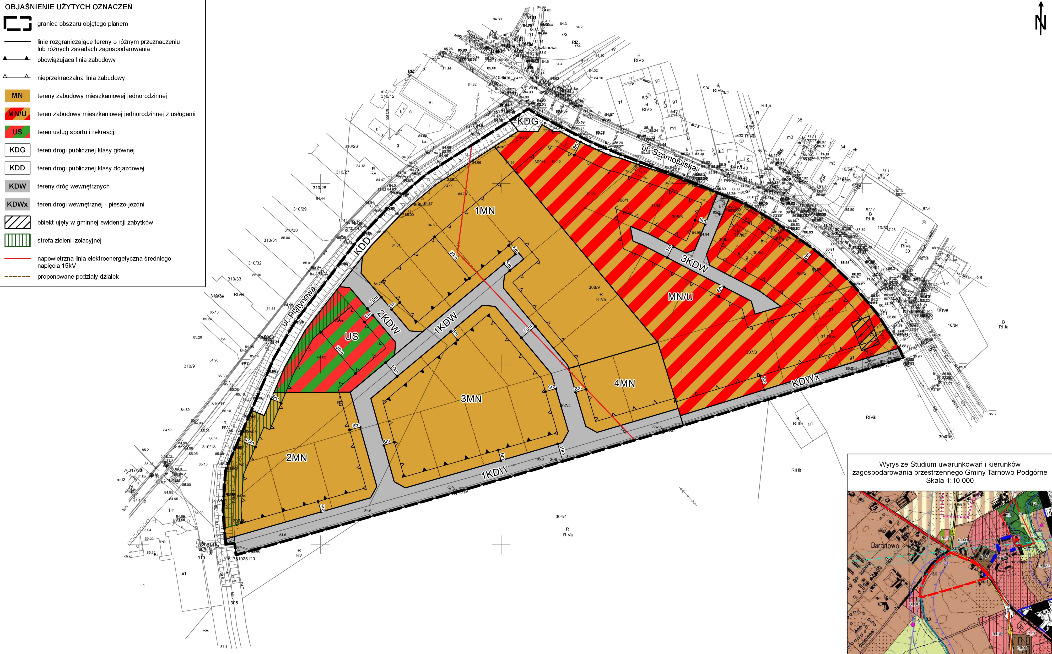
Wyrys ze Studium uwarunkowań i kierunków zagospodarowania przestrzennego Gminy Tarnowo Podgórne Skala 1:10 000